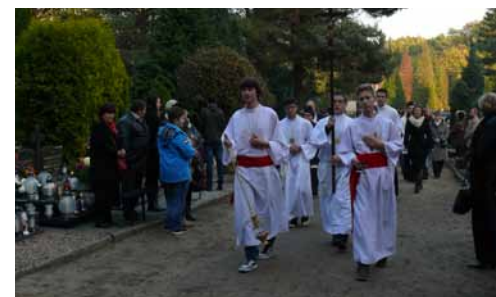
Wszystkich Świętych na obornickim cmentarzu.