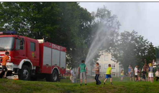
Strażacy chętnie dopomogli tym, którym brakowało deszczu.