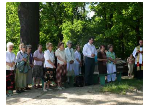
Nabożeństwo majowe przy krzyżu na Grzybku w Zesłanie Ducha Świętego, 19 maja 2013.