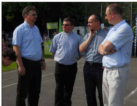
Czym się martwią? Ksiądz Irekzaraz przyjdzie!

Nasza Parafia – pismo redagowane przez wiernych parafii Najświętszego Serca Pana Jezusa oraz św. Judy Tadeusza i św. Antoniego Padewskiego w Obornikach Śląskich.