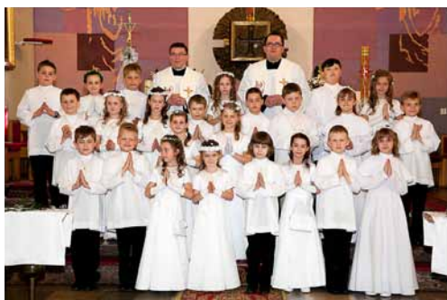
I KOMUNIA ŚWIĘTA KLASA II A OBORNIKI ŚLĄSKIE 19 MAJA 2013