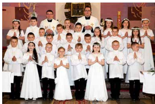
I KOMUNIA ŚWIĘTA KLASA II C OBORNIKI ŚLĄSKIE 19 MAJA 2013