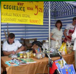
Cegielnia co roku cieszy się nie- słabnącą popularnością.