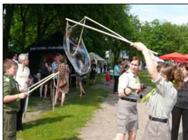
Czyja banka większa?