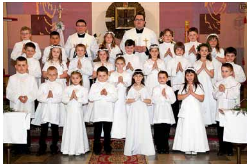
I KOMUNIA ŚWIĘTA KLASA II B OBORNIKI ŚLĄSKIE 19 MAJA 2013