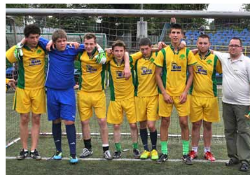
Drużyna parafii JTiAP.

Mecze odbywały się na Stadionie Piłkarskim im. braci Kotlarczyków w Krakowie, nieopodal Wisły, w cieniu Wawelu. Nie udało nam się zająć pierwszego miejsca, ale liczyła się przede wszystkim dobra zabawa. W Turnieju brali udział nie tylko ministranci, ale także młodzież związana z naszą parafią. Atmosfera była bardzo dobra, o czym może świadczyć choćby to, że chłopaki z mojej drużyny zwracali się do mnie nie Księżo, a Ojczek! Dziękuję mojej drużynie za grę i za chęć walki, mimo że było ciężko!