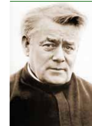
Duchowe drogowskazy ojca Franciszka Jordana (cz. 8)