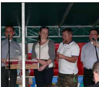
Wręczenie Nagrody Głównej.