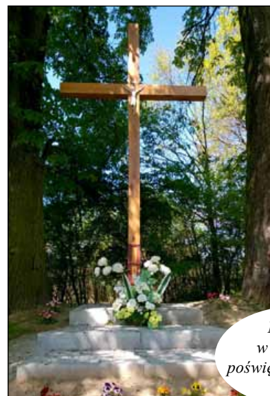
Nowy krzyż w Piekarach, poświęcony 16 IV 2016 r.