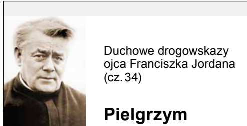
Duchowe drogowskazy ojca Franciszka Jordana (cz. 34)

*) Historycy podają bowiem jedynie hipotetyczne miejsca – wskazują na Ratyzbone, Kolonie, Czechy, Poznań, Gniezno i Ostrów Lednicki – „świętą wyspę”, jak pisał o niej Ignacy Józef Kraszewski, gdzie odkryto baptysterium datowane na II połowę X w.