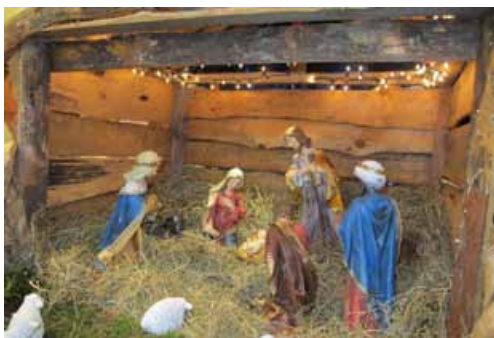
Szopka w kaplicy w Golędzinowie.