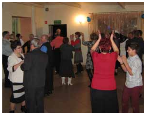
Po części oficjalnej były i tańce.

Klimat spotkania stał się swobodniejszy, gdy rozśpiewały się „Malwy”, wykonując z właściwą sobie energią kolędy, a w dalszej części przyśpiewki ludowe i pieśni biesiadne. Należy podkreślić, że zespół „Malwy” to wizytówka nie tylko Kuraszkowa, ale całej