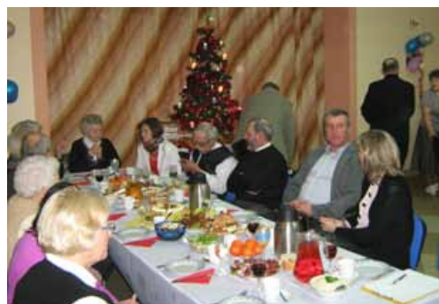
Uczestnicy spotkania przy choince i bogato zastawionych stołach.