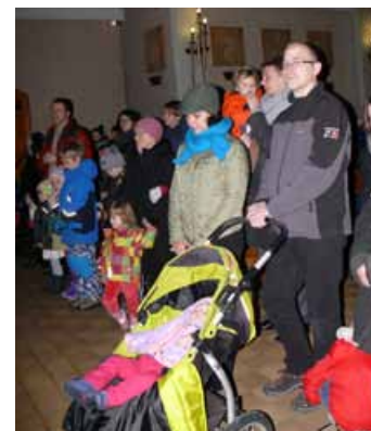
Błogosławieństwo dzieci rocznych w kościele NSPJ 11 stycznia 2015 r.