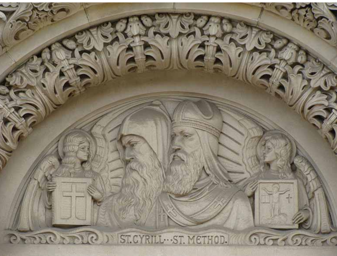
Kościół św. Michała, Homestead, Pennsylvania

Pismo redagowane przez wiernych obu parafii w Obornikach Śląskich