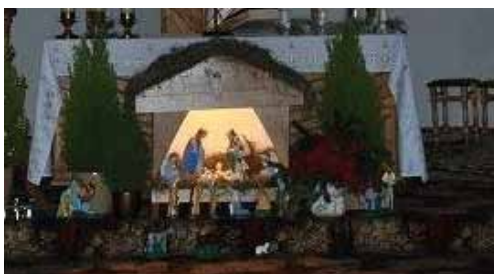
Szopka w kaplicy w Kowalach.