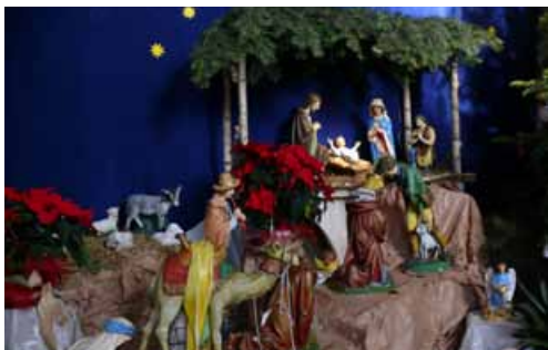
Szopka w kościele NSPJ.