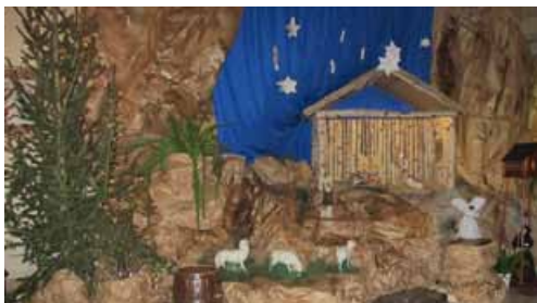
Szopka w kościele JTiAP.