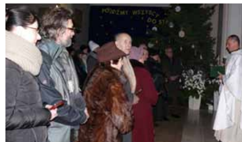
Błogosławieństwo małżeństw w kościele NSPJ w święto Świętej Rodziny 28 grudnia 2014 r.