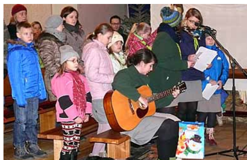
Parafia NSPJ.

W przedświąteczny poniedziałek 22 grudnia 2013 roku w obu naszych kościołach można było otrzymać Betlejemskie Świątełko Pokoju. Po Mszy św. roratniej o godz. 17.00 harcerze przekazywali je wszystkim chętnym.