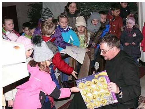
Podsumowanie Adwentu pod hasłem „Uboga Droga” w parafii NSPJ.

Nie zatrzymam pędzącego świata. Mogę jedynie zmienić proporcje pomiędzy własnym życiem a życiem „medialnym”. Pomocą w tym jest dla mnie chrześcijaństwo, którego rugowania z życia publicznego jestem świadkiem. W narodzie, który od zorganizowania się w państwo związał się z cywilizacją łacińską, robi się wszystko m.in. poprzez media tzw. publiczne, by dominowała kultura śmierci. Komu dzisiaj zależy na tym, by nie ukazywać w mediach wiary naszych ojców wśród dzieci i wśród młodych ludzi wchodzących w życie?