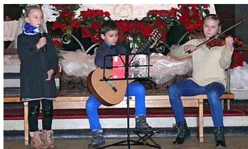
Laureaci tegorocznego Konkursu Dzieciątka Jezus.

W świąteczne popołudnie drugiego dnia świąt Bożego Narodzenia w kościele NSPJ odbyła się kolejna (czwarta już) edycja Konkursu Dzieciątka Jezus. W konkursie mogły wziąć udział dzieci od przedszkolaków do gimnazjalistów. Repertuar stanowiły kolędy lub pastorałki.