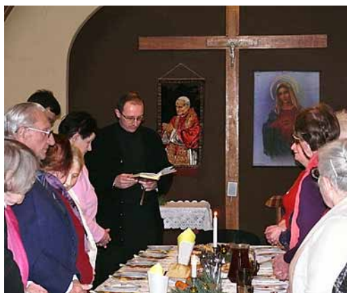
Fot. Barbara Wrześcińska