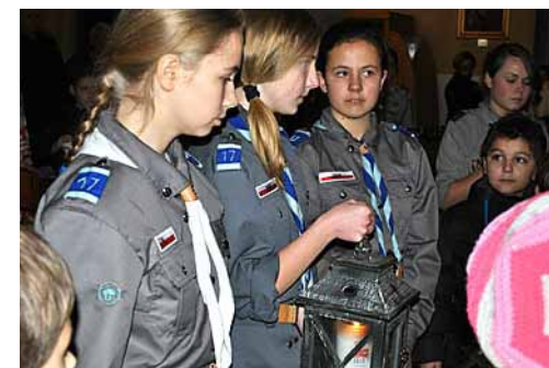
Parafia JTiAP.